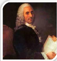
Francois Quesnay (1694-1774)